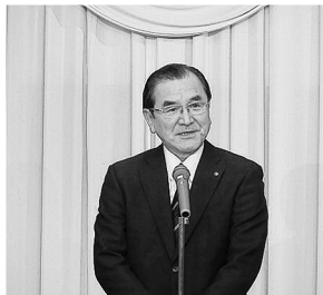
▲来賓挨拶する宮内会頭