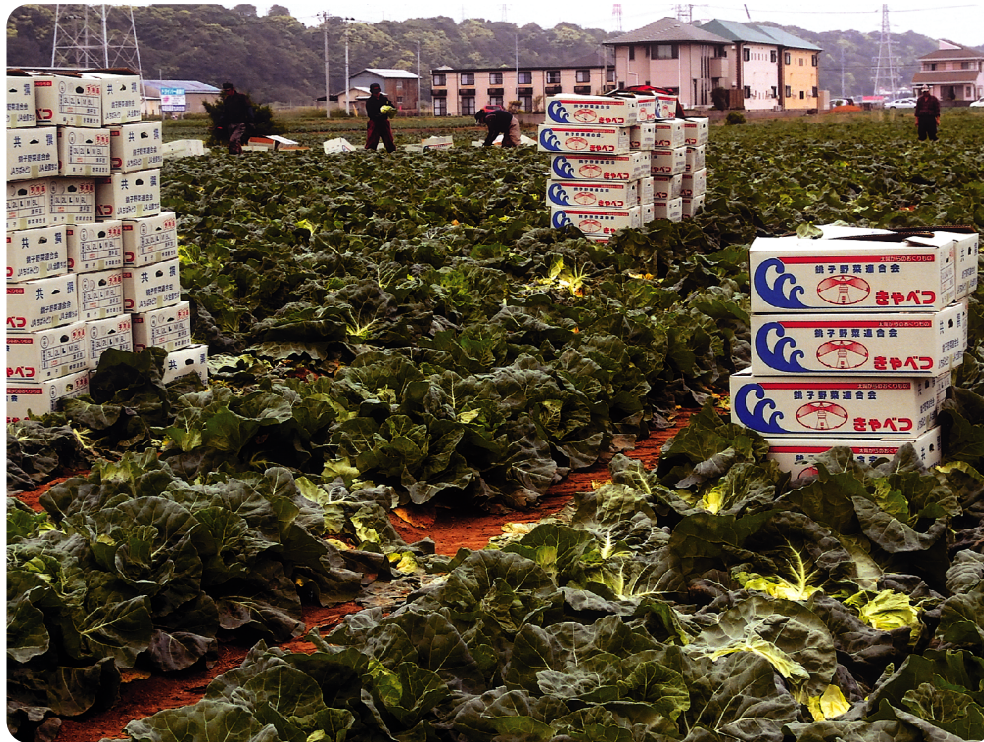
▲灯台キャベツ出荷最盛期