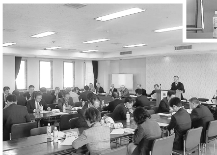
▼ 熱心に協議する委員会メンバー